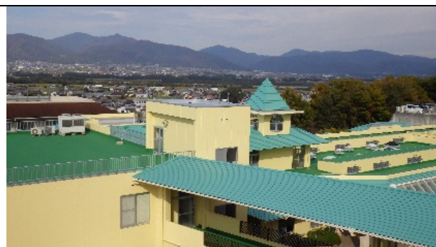
地域交流ホームふれあい屋上