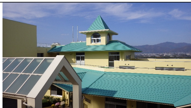
特別養護老人ホーム美山苑屋根