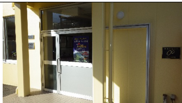
地域交流ホームふれあい玄関