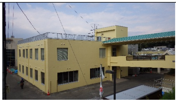
地域交流ホームふれあい全景