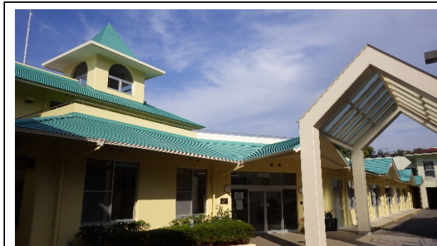
特別養護老人ホーム美山苑正面