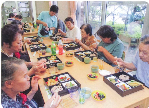
和やかに松花堂敬老御膳でお祝い (吉野川市養護老人ホーム芳越荘)