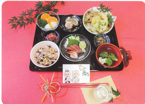
祝・敬老会 和食でお・も・て・な・し (特別養護老人ホーム美山苑)