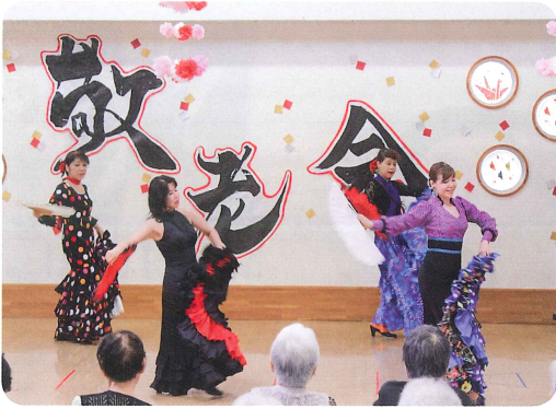
フラメンコサークル様による可憐な踊り (デイサービスセンター和紙のさと)