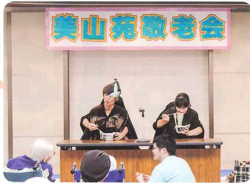
二人羽織で盛り上がりました (特別養護老人ホーム美山苑)