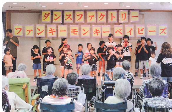
ファンキーモンキーベイビーズ様