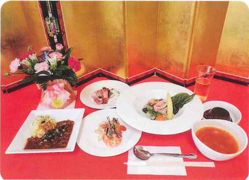
祝・敬老会 フルコースでお・も・て・な・し (デイサービスセンター和紙のさと・つつじ)