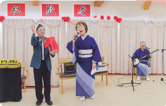
かんまん会様による演芸 (デイサービスセンターつつじ)